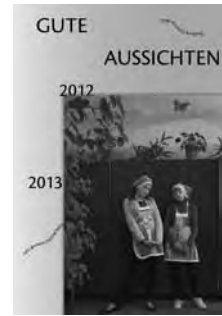
2012/2013 14,8 x 21 cm, 208 Seiten, 300 Abb., 19,00 Euro ISBN 978-3-941-263512