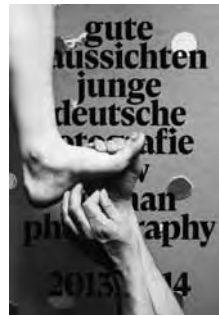
2013/2014 16 x 24 cm, 224 Seiten, 320 Abb., 20,00 Euro ISBN 978-3-86895-337-4