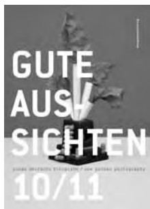
2010/2011 19 x 26 cm, 240 Seiten, 300 Abb., 39,90 Euro ISBN 978-3-83919-602-1