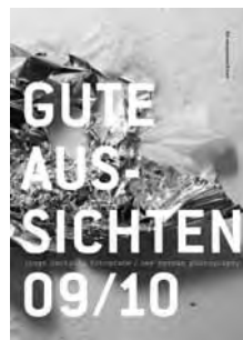
2009/2010 19 x 26 cm, 240 Seiten, 293 Abb., 39,90 Euro ISBN 978-3-83917-357-2