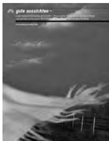
2007/2008 17 x 21 cm, 204 Seiten, 349 Abb., 29,90 Euro ISBN 978-3-83348-743-9