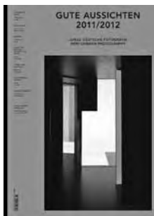
2011/2012 19 x 26 cm, 240 Seiten, 300 Abb., 39,90 Euro ISBN 978-3-84485-289-9