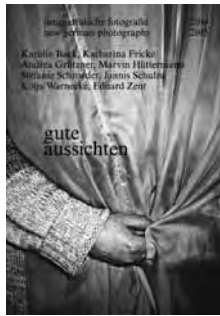
2014/2015 16,5 x 24 cm, 224 Seiten, 330 Abb., 19,95 Euro ISBN 978-3-86490-226-0