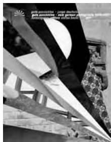
2006/2007 17 x 21 cm, 220 Seiten, 154 Abb., 29,90 Euro ISBN 978-3-83346-484-3