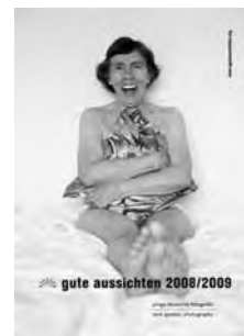
2008/2009 19 x 26 cm, 220 Seiten, 304 Abb., 39,90 Euro ISBN 978-3-83704-875-9