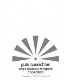
2004/2005 17 x 21 cm, 196 Seiten, 190 Abb., 24,90 Euro ISBN 978-3-83342-213-3