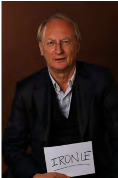
Klaus Staeck, Künstler, Verleger und Präsident der Akademie der Schönen Künste in Berlin mit ...

Informationen zur Frankfurter Buchmesse im Web: Frankfurter Buchmesse