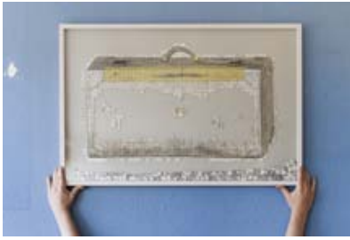
Wir puzzeln uns ein Bild vom Bild, das dann auch so aussehen kann, wie ...