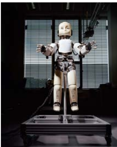
Mensch & Maschine im Labor und Bild: Janosch Boerckels "Nonplusultra"

Magazins NEON sowie Ingo Taubhorn , Kurator am Haus der Photographie, Deichtorhallen Hamburg.