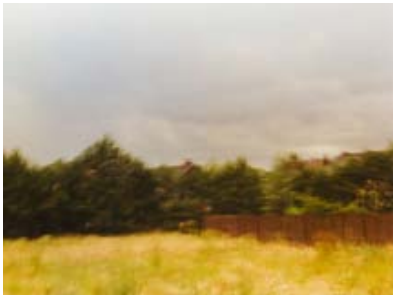
Stephan Bögels "Scenic Utah" (auch oben): Unfassbares in Bilder fassen