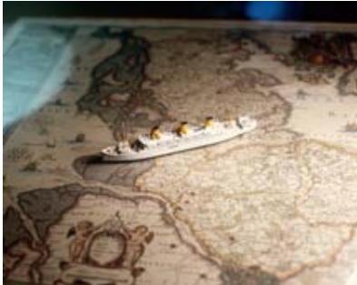
... dieses in Julian Slagmans Arbeit "Vergissmeinnicht"