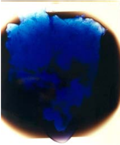
"Fotopapier, Licht, Ei": Alba Frenzels unikate Fotogramme von Eiern in allen Formen und Zuständen