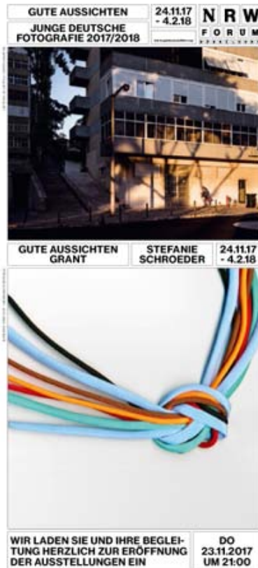
Ab 23.11.17 im NRW-Forum Düsseldorf: gute aussichten 2017/2018 & der ...

➔ AKTUELL PRESSEKIT PRESSESPiegel ARCHIV KONTAKT