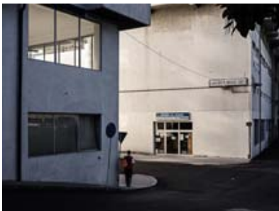
Runes Nunes verwandelt in "Place of Disquiet" Städte zu Landschaften