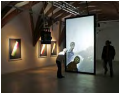
... in Szene gesetzt