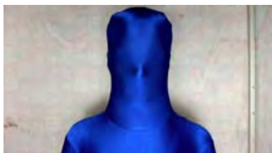
Auch im Ganzkörperanzug immer voller Einsatz: Ein Motiv aus Stefanie ...

Acht Jahre lang hat Stefanie Schroeder die Jobs dokumentiert, die ihr das Kunststudium ermöglicht haben. In geradezu Furcht einflößender Sachlichkeit führt der Film "Ein Bild abgeben" vor, wozu die Fotografie im Stande ist: Sie dient als Beweis- und Anklagemittel, als Pressefoto, als leere Hülle und Camouflage, wird zum Andenken, Werbepäsent oder Bild-Brezelherz degradiert. Ein Bild abgeben zeigt uns Fotografieren als Handlung. Eine teilnehmende (Selbst-)Beobachtung der Fotografin, die damit offenlegt, dass Fotografie nicht nur Bilder hervorbringt, sondern auch immer von sich selbst ein Bild abgibt – in jeder Hinsicht.