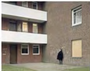
Kolja Warnecke folgte in seiner Arbeit den "spuren." von Bea

Hoffnungen der Insulaner spürbar werden lassen. "Quisqueya" ist ein subjektiver Reisebericht und gleichzeitig ein hybrides, vielfältiges Fotoarchiv, das als Buch genauso funktioniert wie als Präsentation an der Wand – der Fotograf als Geschichtenerzähler.