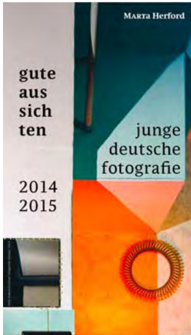
Einladungskarte zur ersten gute aussichten 2014/2015 Ausstellung ins Marta Herford

➔ AKTUELL ARCHIV PRESSEKIT PRESSESPIEGEL KONTAKT