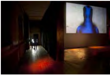
... Schroeders Film "Ein Bild abgeben"