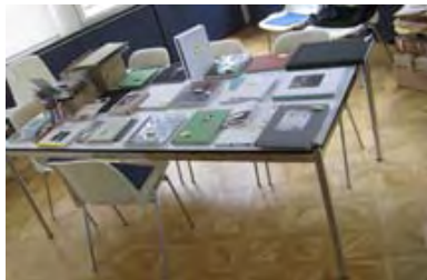
Und so beginnt es immer: Die über 110 Einsendungen zu "gute aussichten 2014/2015"

Neustadt/Weinstrasse, Dienstag, den 4. November 2014