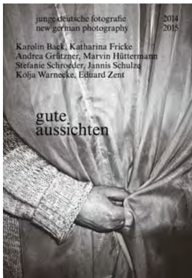
gute aussichten 2014/2015 Katalog

Katalog (Deutsch/Englisch) erscheinen, herausgegeben von Stefan Becht & Josefine Raab, der die acht Preisträger und ihre Arbeiten in Wort und Bild vorstellt und in jeder Buchhandlung, in allen Web-Stores oder direkt hier info(at)guteaussichten.org erhältlich ist: 224 Seiten, ca. 330 Abbildungen, praktisches Readerformat 16,5 cm x 24 cm, broschiert, 19,95 Euro, erschienen im dpunkt Verlag, Heidelberg, ISBN 978-3-86490-226-0.