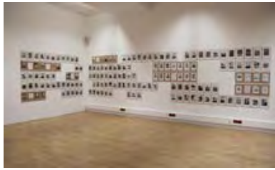
... Sennestadt fotografisch inszeniert