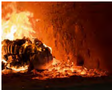
Was von uns geht und was bleibt: Marvin Hüttermanns sensible Serie "Es ist so nicht gewesen"

Was bleibt, wenn nichts mehr ist? Verschwinden wir spurlos? Was wird aus dem, was wir zurücklassen? Schlichte Fragen, denen wir ausweichen und die wir so einfach nicht beantworten können. Marvin Hüttermann hat sich mit dem Tod, den Verstorbenen und deren Hinterlassenschaften auseinandergesetzt. Dazu hat er in den Wohnungen der Toten, in Bestattungsunternehmen und im Krematorium fotografiert. Die Serie "Es ist so nicht gewesen" kombiniert in sorgsam aufeinander abgestimmten Bildpaaren, was noch da ist, mit dem, was gegangen ist.