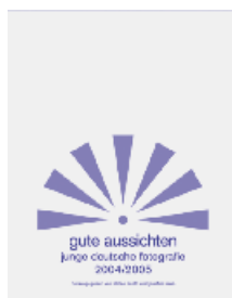
2004/2005 17×21 cm, 196 Seiten 190 Abb., 24,90 Euro ISBN 978-3-83342-213-3