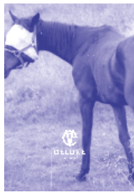
DELUXE Magazin 20×28 cm, 180 Seiten 241 Abb., 10,- Euro ISBN 978-3-9819355-1-6