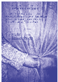
2014/2015 16,5×24 cm, 224 Seiten 320 Abb., 19,95 Euro ISBN 978-3-86490-226-0