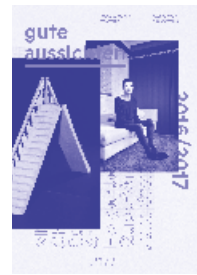
2016/2017 16,5×24 cm, 224 Seiten 381 Abb., 24,90 Euro ISBN 978-3-944874-54-8