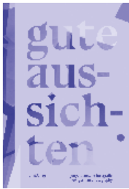
2018/2019 16,5×24 cm, 224 Seiten ü. 400 Abb., 20,- Euro ISBN 978-3-981935-52-3