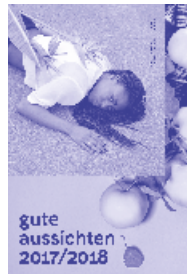
2017/2018 16,5×24 cm, 224 Seiten 373 Abb., 20,- Euro ISBN 978-3-981935-50-9