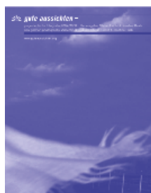
2007/2008 17×21 cm, 204 Seiten 349 Abb., 29,90 Euro ISBN 978-3-83348-743-9