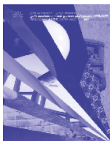
2006/2007 17×21 cm, 220 Seiten 154 Abb., 29,90 Euro ISBN 978-3-83346-484-3