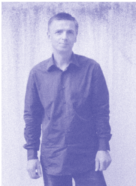
Andreas Gursky, international renommierter Fotograf und erster Gast-Juror bei gute aussichten, im Sommer 2004 im Kölner Hinterhof der Zeitschrift SPEX