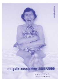
2008/2009 19×26 cm, 220 Seiten 304 Abb., 39,90 Euro ISBN 978-3-83704-875-9