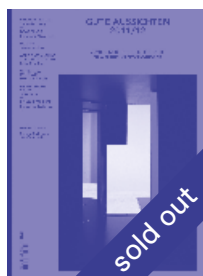
2011/2012 19×26 cm, 240 Seiten 300 Abb., 39,90 Euro ISBN 978-3-84485-289-9

Since 2017 the catalogues have been issued by gute aussichten gGmbH, which is also where you can order all catalogues that are not sold out yet: info@guteaussichten.org .