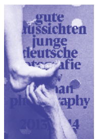
2013/2014 16×24 cm, 224 Seiten 320 Abb., 20,- Euro ISBN 978-3-86895-337-4