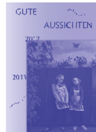
2012/2013 14,8×21 cm, 208 Seiten 300 Abb., 19,- Euro ISBN 978-3-941-263-51-2