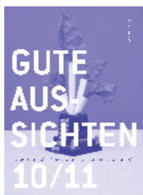
2010/2011 19×26 cm, 240 Seiten 300 Abb., 39,90 Euro ISBN 978-3-83919-602-1