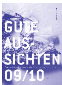
2009/2010 19×26 cm, 240 Seiten 293 Abb., 39,90 Euro ISBN 978-3-83917-357-2