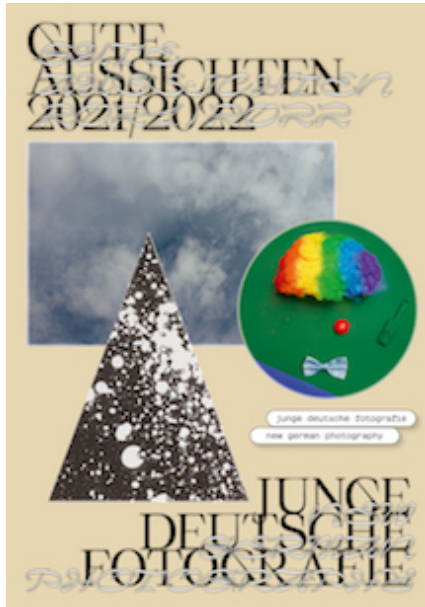
Cover des gute aussichten 2021/2022 Kataloges ...