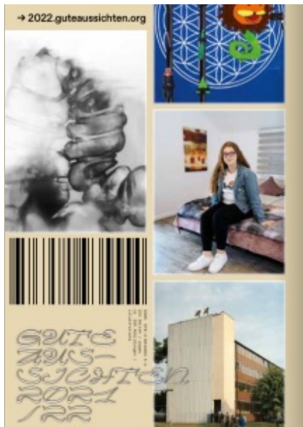
... und das Backcover

In ihren prämierten Werken hantieren die gute aussichten Preisträger*inn*en 2021/2022 mit Ästhetiken, Stilen und Techniken entlang dieses gedachten Zeitstrahls und veranschaulichen in ihren Projekten ausschnitthaft Stationen der Geschichte der Fotografie. Ihre Arbeiten bekräftigen die außerordentliche Vielfalt, Vitalität und Beweglichkeit des Mediums, in dem Geschichte parallel verläuft. So stehen in großer Selbstverständlichkeit KI-gestützte Werke und transmediale Ansätze neben einer bildnerischen Forschung, die analoge wie digitale Parameter umgreift, dokumentarische Positionen, die auf den Wahrheitsgehalt der Fotografie referieren neben Ikons als kommunikative Schnipsel geboren in der virtuellen Flüchtigkeit des Internets.